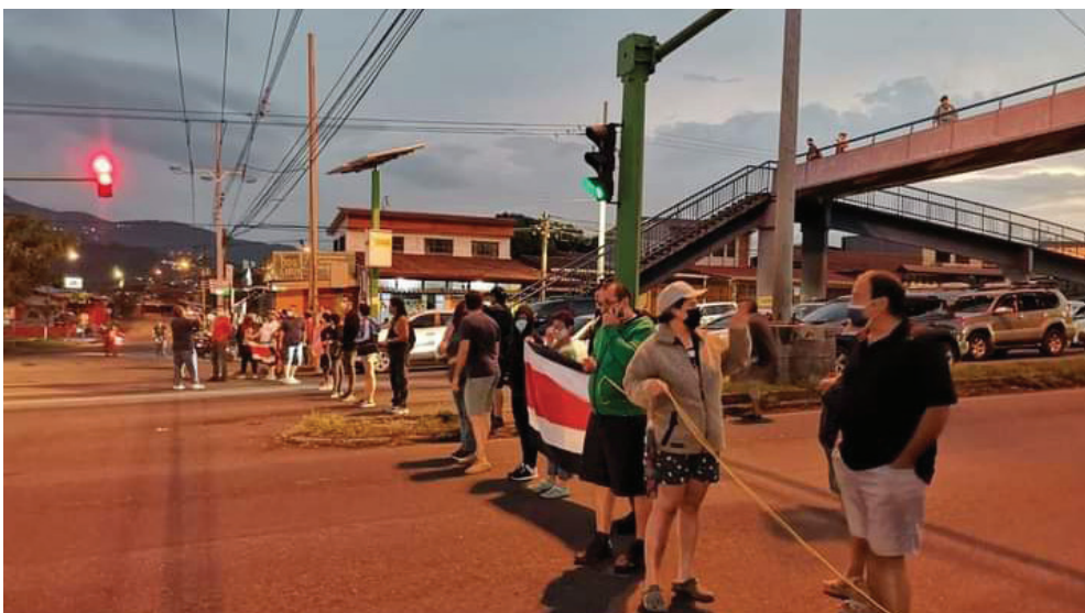
Protesta en Hatillo por el agua. Año 2022

La problemática del acceso al derecho humano al agua se agudiza porque se les da más importancia a los intereses económicos de los grandes empresarios neoliberales que a los intereses de la clase trabajadora por lograr construir vida digna para todos. Esta sólo tendrá una solución definitiva cuando el pueblo se organice y haga que prevalezcan sus intereses sobre los intereses de los empresarios privados, dueños del capital y, en este caso, de la voluntad del gobierno de la Ciudad de México. ■