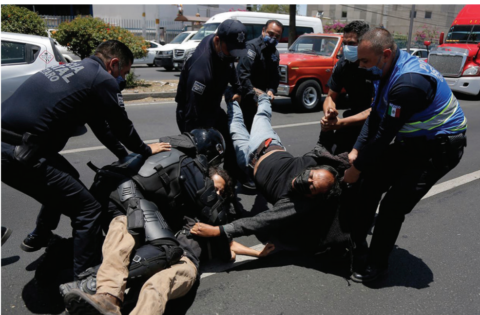
Policías reprimiendo a quienes protestan por la defensa del agua. Año 2022.