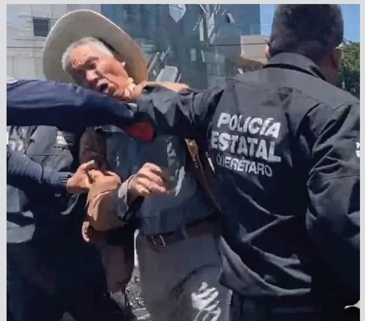
En defensa por el agua. Pueblo de Santiago Mexquititlan. Año 2022.

¡Luchar con dignidad, con el pueblo organizado, luchar hasta vencer!