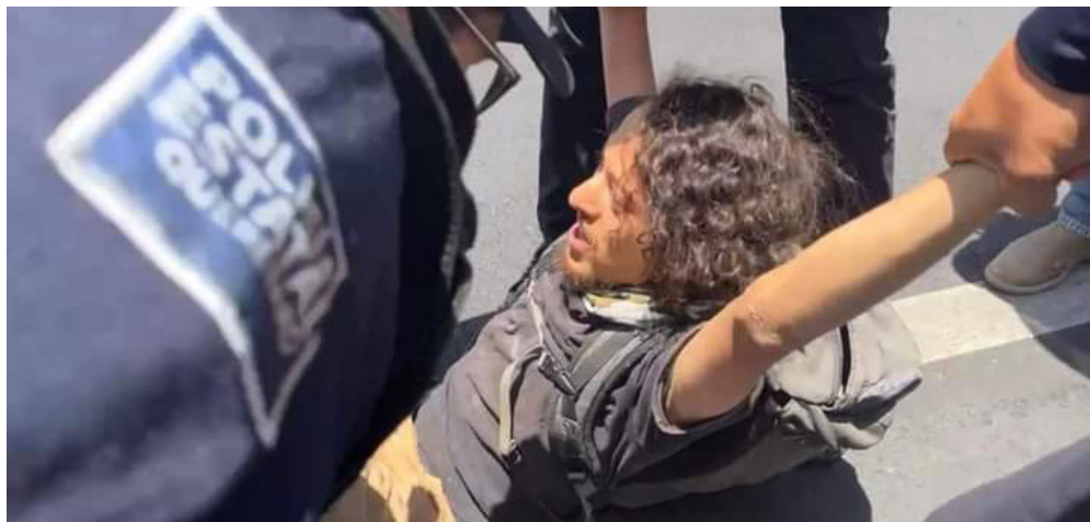
Represión a manifestante que protesta contra la privatización del agua. Año 2022

Si bien el actual gobierno federal ha limitado en cierta medida la ganancia de la burguesía y