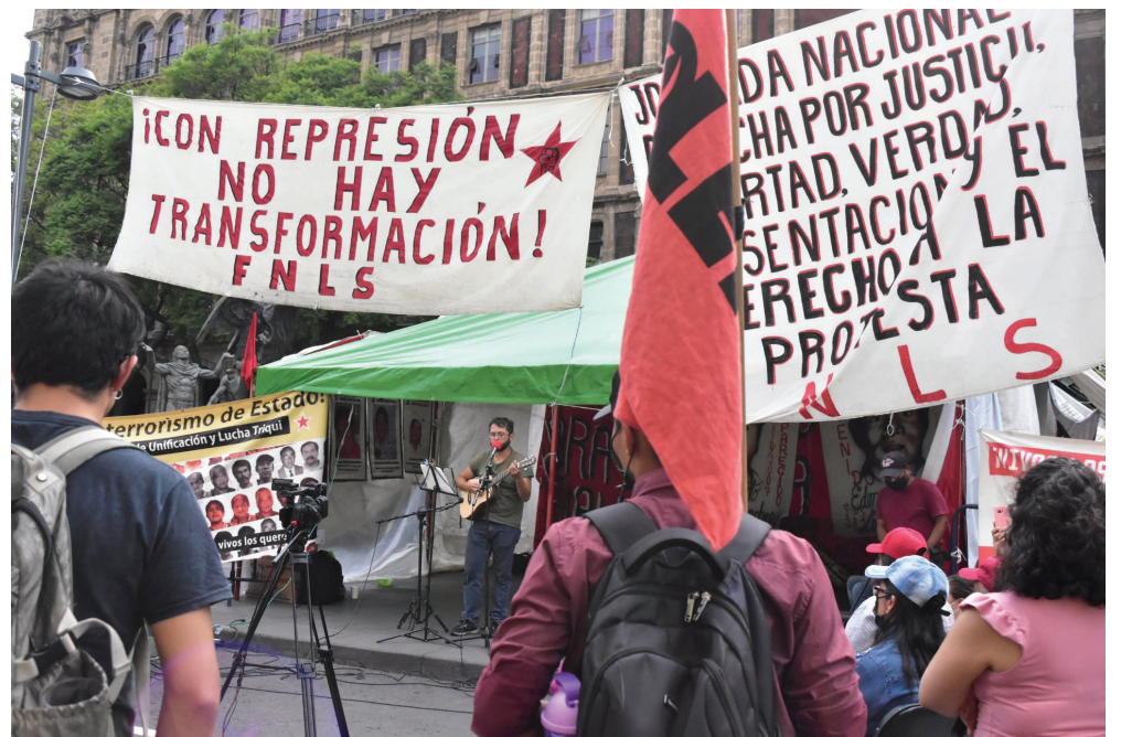
Plantón popular en la Semana Internacional del Detenido-Desaparecido.

Durante el gobierno de Marcelo Ebrad también se impulsó acusar a personas del llamado “delito contra la paz pública”, recluyendo a 69 personas que podían ser condenadas a